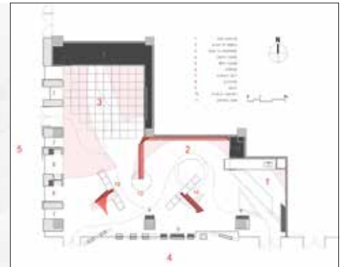
planta general floor plan

AIRMIX is a lifestyle boutique located in Xi'an, designed by SpActrum. AIRMIX Lifestyle Boutique (Xi'an Store) is the first showroom store of the newly established lifestyle boutique buyer brand. The challenge of the project consists in a relatively small shop area, where a strong image of the new brand is to be showcased while building a significant identity for AIRMIX. It starts by redefining the position that lifestyle holds for human life. Rather than something adhesive to everyday life, SpActrum understands lifestyle as an essential need deep inside humanity. It's fragile yet unhesitatingly steady. It's like a bubble of soap, transient and pleasuring. Bubbles become both a metaphor for such need and the form-making concept of the design.